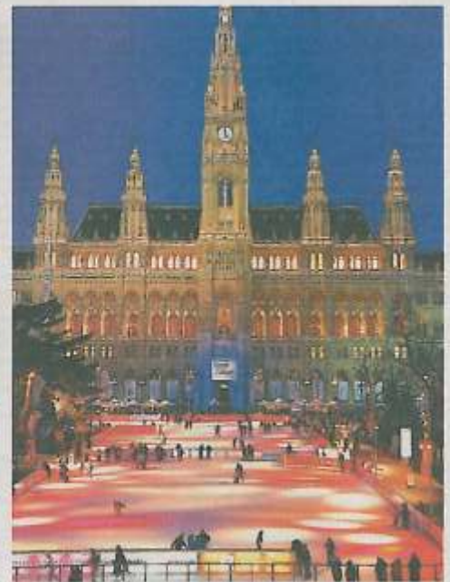
Im Moskauer Gorki Park (links) entstand die größte mobile Eislaufbahn der Welt, ab Jänner sorgt AST auch wieder für den „Wiener Eistraum“ vor dem Rathaus.