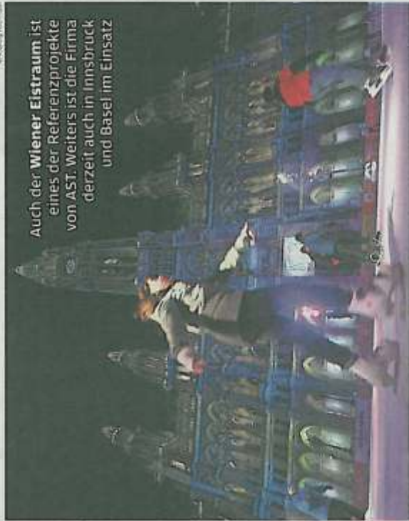
Auch der Wiener Eistraum ist eines der Referenzprojekte von AST. Weiters ist die Firma derzeit auch im Innsbruck und Basel im Einsatz