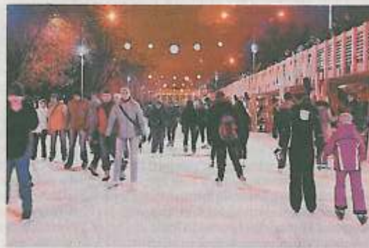
Im Gorki Park wurde ein riesiges Eislabirynth mit Technologie aus Reutte eröffnet. Hunderttausende Besucher werden erwartet.

Moskau - Russland wollte klotzen und nicht kleckern: Im Beisein von viel Prominenz wurde vom Tiroler Weltmarktführer im berühmten Gorki Park in Moskau eine drei Mio. Euro teure Eislandschaft eröffnet, die bisherige Dimensionen sprengt: Die weltweit modernste und größte mobile Kunsteisbahn-Anlage ist 15.000 Quadratmeter groß, das entspricht etwa achtmal der Fläche, die international für Eishockeyspiele vorgeschrieben ist. (na)