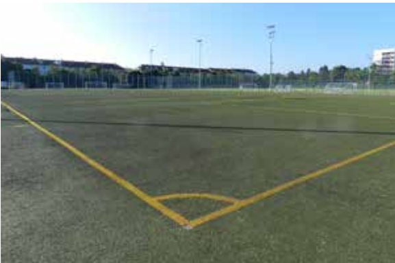
TSV 1860 München