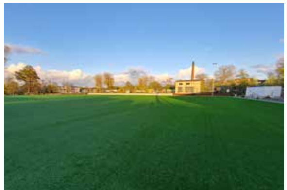
1. FC Union Berlin