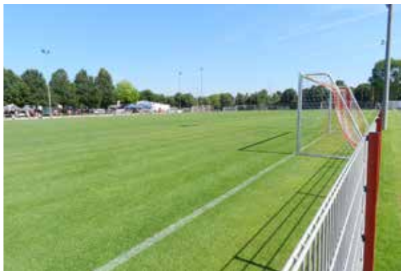
FC Bayern München