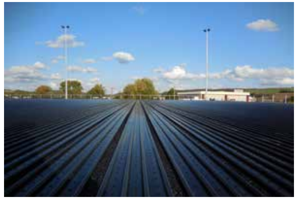
TSG 1899 Hoffenheim