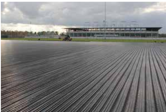
FC Ingolstadt 04