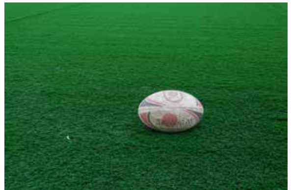
HRK Rugby Sportplatz Heidelberg