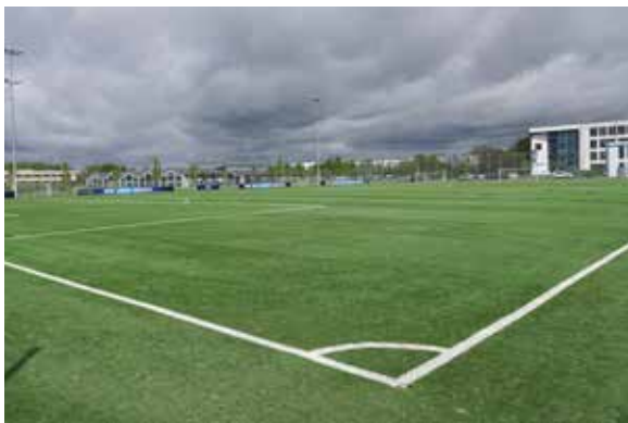
SC Paderborn 07